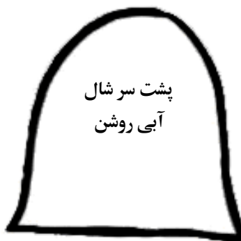
پشت سر شال آبی روشن