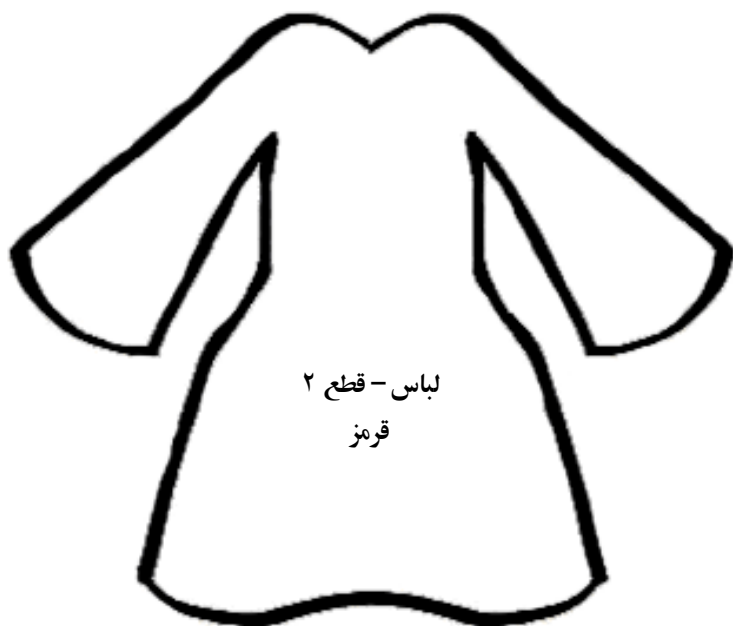
لباس - قطع ۲ قرمز