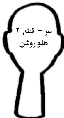
سر - قطع ۲ هلو روشن