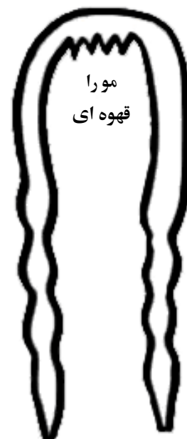
مورا قهوه ای