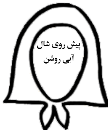
پیش روی شال آبی روشن